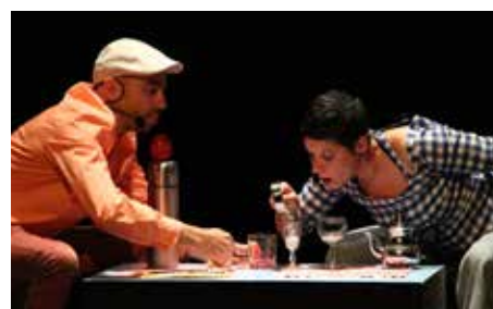
Sur la nappe