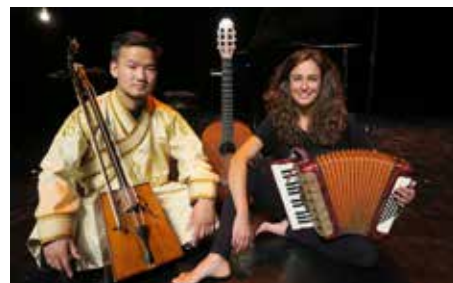
La légende de Tsolmon

Conçu pour les plus jeunes, ce spectacle explore la vocalité, les sons, les formes et les couleurs, invitant les enfants à partager un voyage sensoriel et poétique. Guitare acoustique, ukulélé, petites percussions, objets sonores, chant.