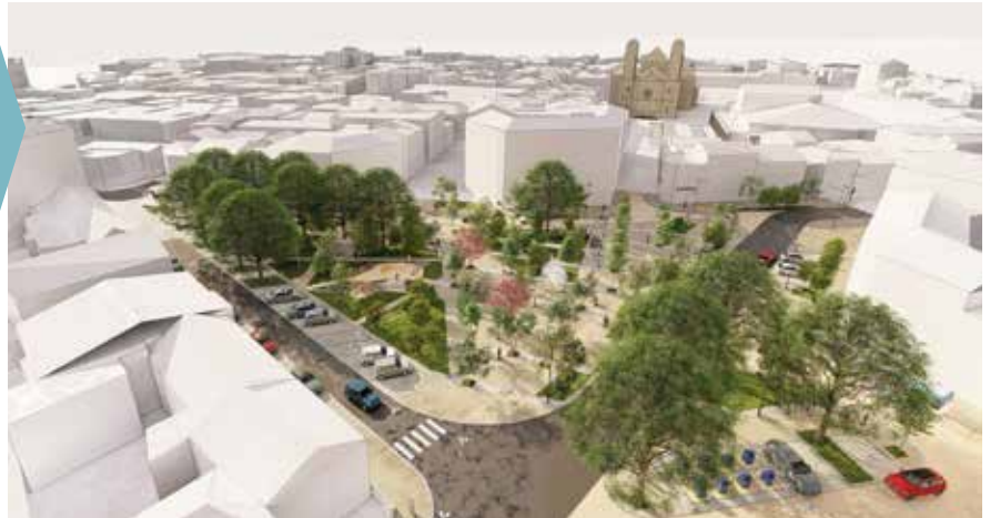
© Cabinet d'urbanistes-paysagistes /Anton et Associés - DR

La place sera totalement transformée pour en faire un lieu de vie agréable et vivant, entièrement végétalisé, offrant une belle perspective sur la cathédrale. Le futur espace, dont les travaux débuteront en 2026, sera piétonnisé. On y trouvera une aire de jeu pour les enfants, des points d'eau avec une fontaine et des brumisateurs, des arbres, des massifs et des plantes, du mobilier urbain pour pouvoir se poser et profiter de l'environnement.